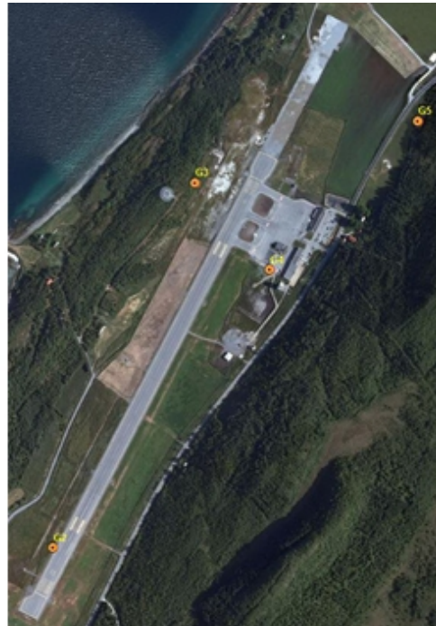
Bilde 1 og bilde 2: Grunnlagspunkt G5 og oversiktskart over grunnlagspunkter på Sandnessjøen lufthavn.